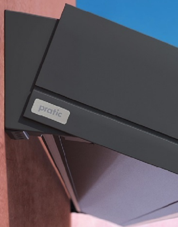
Installazione a soffitto